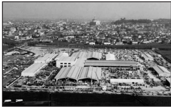
Montichiari e la fiera agricola edizione dell'anno 1986.

Il trasferimento della vecchia sede del mercato, al centro del paese, presso il nuovo polo polivalente, diventato negli anni Centro Fiera e Centro Servizi Agricolo, è stato sicuramente uno dei diversi fattori che ha fatto "esplorare" la fiera e non solo. Detto