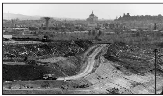
Una delle discariche di Montichiari.

Anche i Revisori del Conto definiscono le entrate da sanzioni ai cavaatori come "aleatorie", e raccomandano all'Amministrazione la massima prudenza, procedendo nell'impegno di tali somme per la