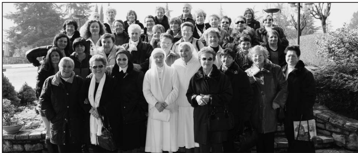
Le partecipanti alla "rimpatriata": quelle che furono le "orfanelle" di Casa Serena con alcune suore.