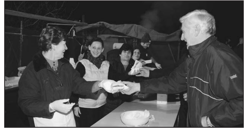
L'impegno di alcuni volontari.