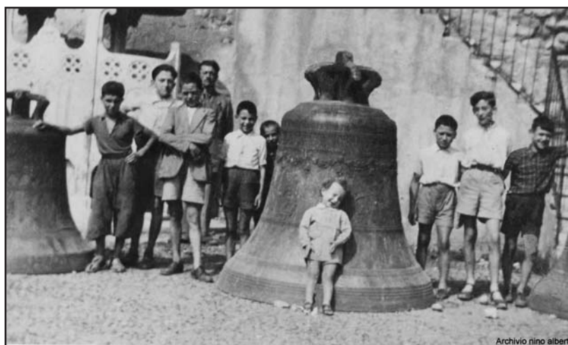
Le campane ai piedi del campanile.

Nel vecchio Montichiari, anche se tenta di diventare di fatto città, i funerali si celebrano ancora come Dio comanda da illo tempore : dalla casa dove si celebra la sera la preghiera funebre e il prete benedice la salma con i parenti e amici in lacrime. Il giorno dopo il funerale con processione fino al lontano cimitero.